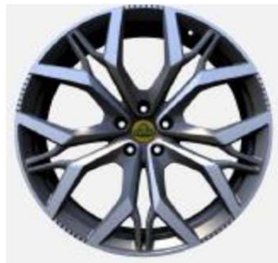
23インチ マルチスポークグレーダイヤモンドチューンドホイール