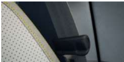
クラウドシートベルト