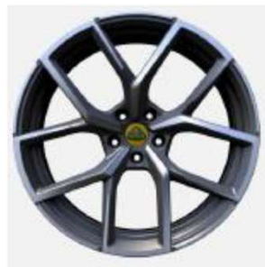
22インチ 10スポークグレーダイヤモンドチューンド鍛造ホイール