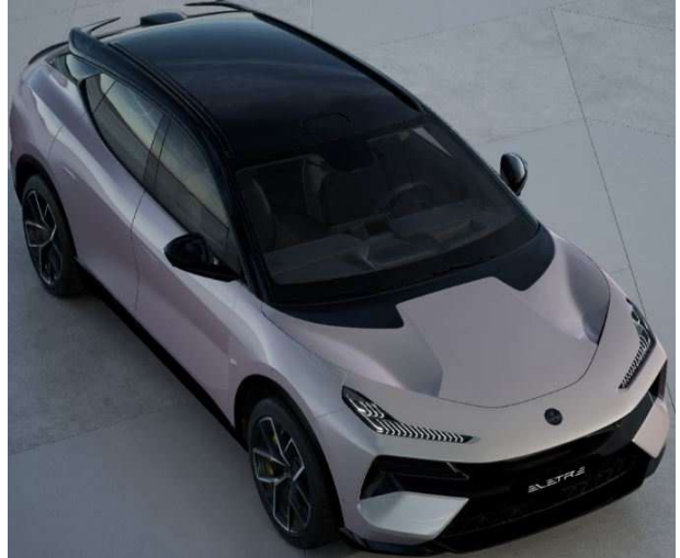
Blossom Grey ブラッサムグレー