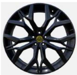
23インチ マルチスポークグロスブラックホイール