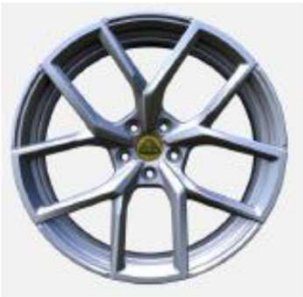
22インチ 10スポークシルバーダイヤモンドチューンドホイール