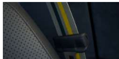
トライカラークラウドシートベルト