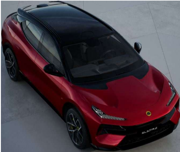
Natron Red ナトロンレッド