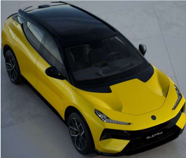
Solar Yellow ソーラーイエロー ●標準装備