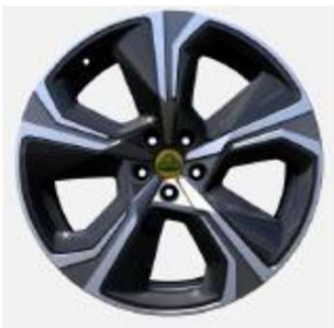
22インチ 5スポークグレーダイヤモンドチューンドホイール + カーボンファイバーインサート入り