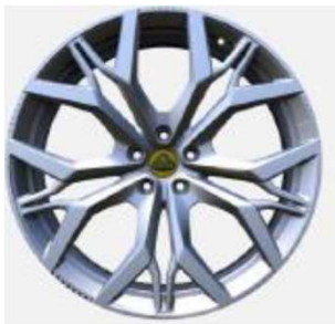
23インチ マルチスポークシルバーダイヤモンドチューンドホイール