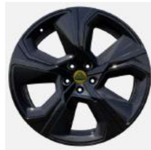
22インチ 5スポークグロスブラックホイール + カーボンファイバーインサート入り