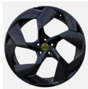
23インチ 5スポークグロスブラックホイール + カーボンファイバーインサート入り