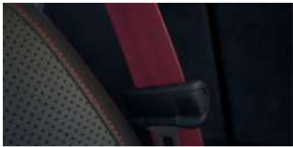
レッドシートベルト