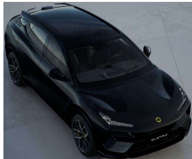
Stellar Black ステラブラック