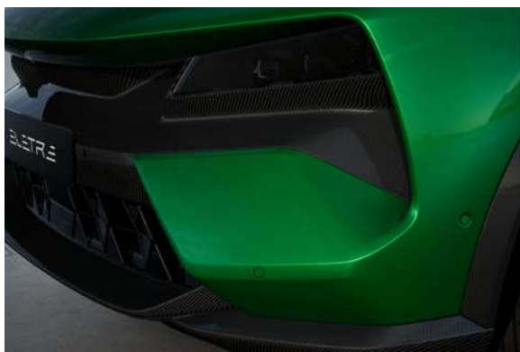
エクステンデッドカーボンパック (フロントリップスポイラー、ロアリアディフューザー、サイドミラーケース、ボンネットパネル、フロントバンパーミッド&ロアパネル、 ホイールライナー、ドアパネル、リアバンパーパ)