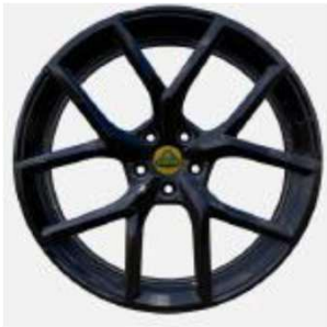
22インチ 10スポークグロスブラックホイール