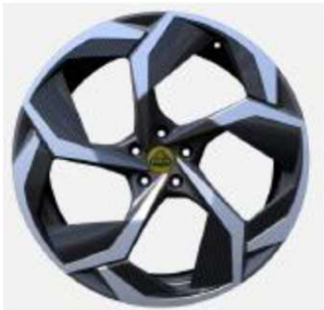
23インチ 5スポークグレーダイヤモンドチューンドホイール + カーボンファイバーインサート入り