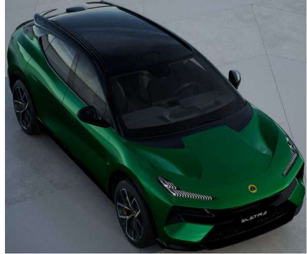
Galloway Green ギャロウェイグリーン