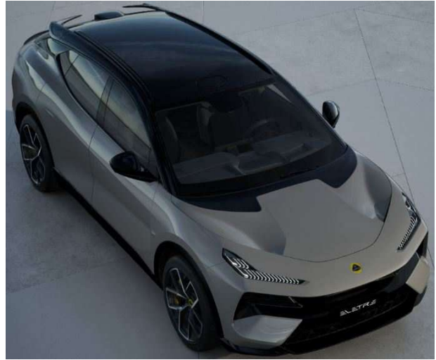
Kaimu Grey カイムグレー ▲選択