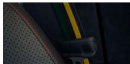
トライカラーブラックシートベルト