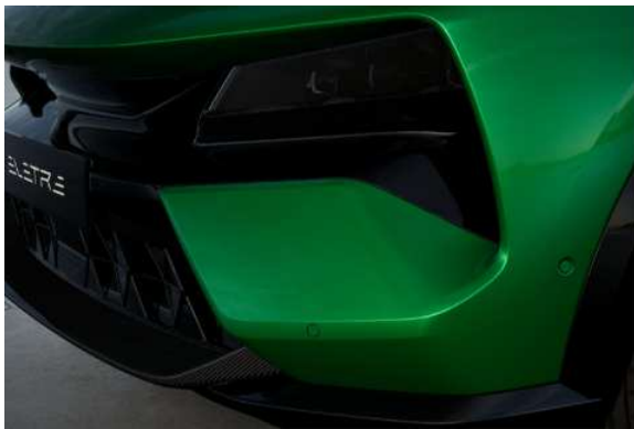
カーボンパック ●標準装備 (フロントリップスポイラー、ロアリアディフューザー、サイドミラーケース)