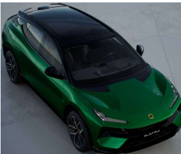
Galloway Green ギャロウェイグリーン