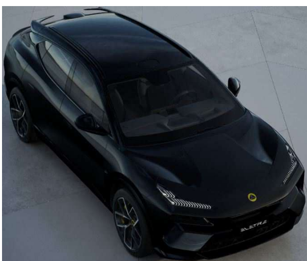
Stellar Black ステラブラック