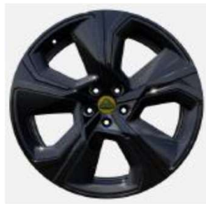
22インチ 5スポークグロスブラックホイール + カーボンファイバーインサート入り