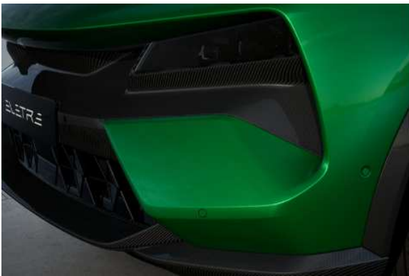
エクステンデッドカーボンパック (フロントリップスポイラー、ロアリアディフューザー、サイドミラーケース、ボンネットパネル、フロントバンパーミッド&ロアパネル、ホイールライナー、ドアパネル、リアバンパーパ)