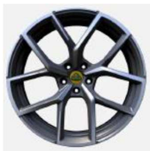
22インチ 10スポークグレーダイヤモンドチューンド鍛造ホイール