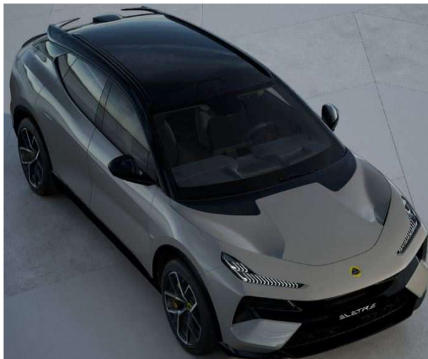
Kaimu Grey カイムグレー ▲選択