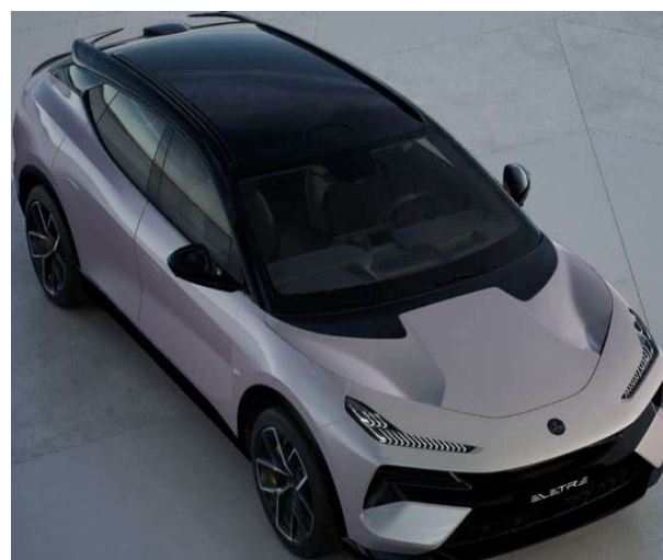
Blossom Grey ブラッサムグレー