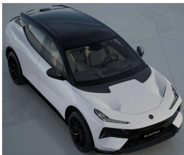
Akoya White アコヤホホワイト