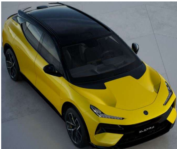
Solar Yellow ソーラーイエロー ●標準装備