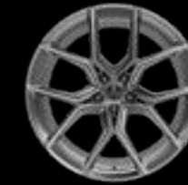
22" 10-SPOKE GLOSS SILVER