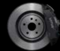
4-PISTON - FRONT GREY CALIPERS