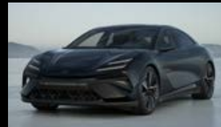
STELLAR BLACK OPTION FOR EMEYA EMEYA S EMEYA R