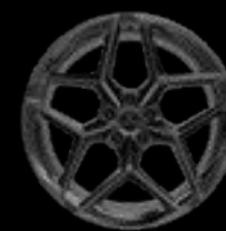
21" 10-SPOKE GREY