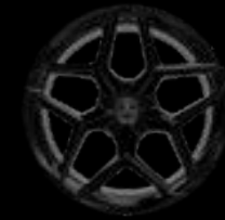
21" 10-SPOKE GLOSS BLACK