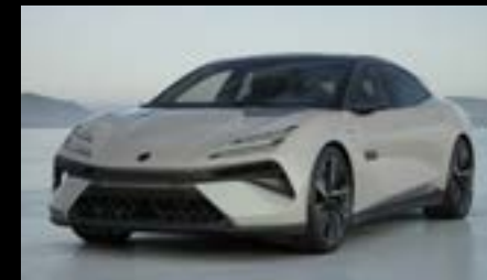
BOREAL GREY OPTION FOR EMEYA EMEYA S EMEYA R