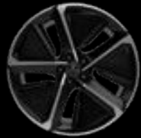
21" 5-SPOKE AERO* GREY