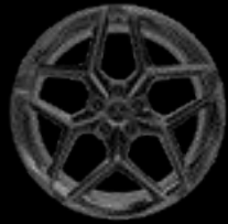
21" 10-SPOKE GREY