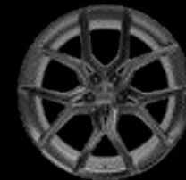
22" 10-SPOKE GLOSS GREY