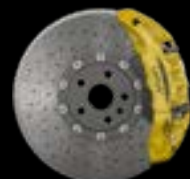
10-PISTON - FRONT YELLOW CALIPERS CARBON CERAMIC BRAKE DISCS

* Not compatible with Carbon Ceramic Brakes