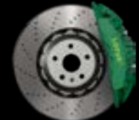
6-PISTON - FRONT GREEN CALIPERS LIGHTWEIGHT BRAKE DISCS