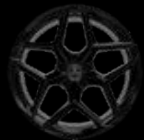
21" 10-SPOKE GLOSS BLACK