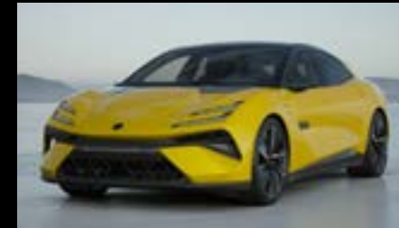
SOLAR YELLOW STANDARD FOR EMEYA R OPTION FOR EMEYA EMEYA S