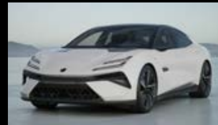
AKOYA WHITE STANDARD FOR EMEYA S OPTION FOR EMEYA EMEYA R