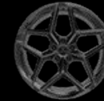
21" 10-SPOKE GREY