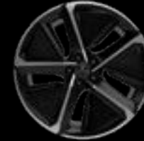
21" 5-SPOKE AERO GREY