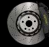
6-PISTON - FRONT BLACK CALIPERS LIGHTWEIGHT BRAKE DISCS