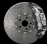
10-PISTON - FRONT SILVER CALIPERS CARBON CERAMIC BRAKE DISCS