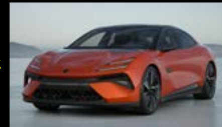
FIREGLOW ORANGE OPTION FOR EMEYA EMEYA S EMEYA R