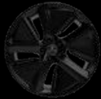
21" 5-SPOKE AERO*