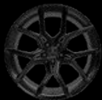
22" 10-SPOKE GLOSS BLACK