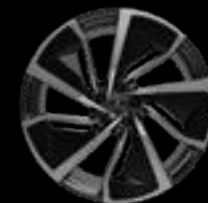
22" 5-SPOKE GLOSS GREY WITH CARBON FIBRE