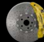
10-PISTON - FRONT YELLOW CALIPERS CARBON CERAMIC BRAKE DISCS

* Not compatible with Carbon Ceramic Brakes