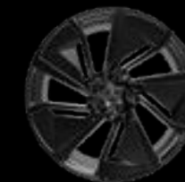
22" 5-SPOKE GLOSS BLACK WITH CARBON FIBRE