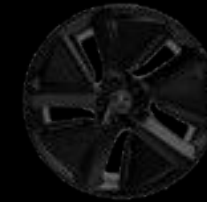
21" 5-SPOKE AERO* GLOSS BLACK