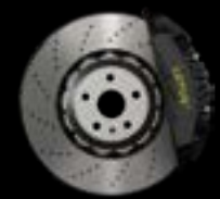
6-PISTON - FRONT BLACK CALIPERS LIGHTWEIGHT BRAKE DISCS