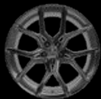
22" 10-SPOKE GLOSS GREY