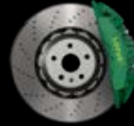
6-PISTON - FRONT GREEN CALIPERS LIGHTWEIGHT BRAKE DISCS