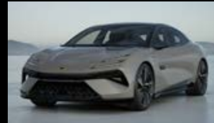
KAIMU GREY STANDARD FOR EMEYA OPTION FOR EMEYA S EMEYA R