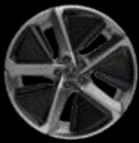
21" 5-SPOKE AERO SILVER