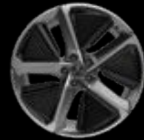
21" 5-SPOKE AERO* SILVER