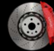
6-PISTON - FRONT RED CALIPERS LIGHTWEIGHT BRAKE DISCS