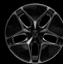
20" 5-SPOKE AERO BLACK