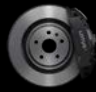
4-PISTON - FRONT GREY CALIPERS