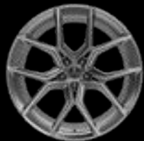
22" 10-SPOKE GLOSS SILVER