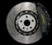
6-PISTON - FRONT BLACK CALIPERS LIGHTWEIGHT BRAKE DISCS