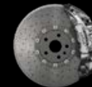
10-PISTON - FRONT SILVER CALIPERS CARBON CERAMIC BRAKE DISCS