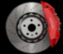
6-PISTON - FRONT RED CALIPERS LIGHTWEIGHT BRAKE DISCS