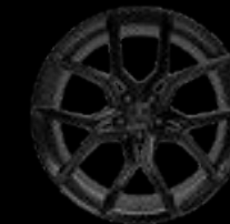
22" 10-SPOKE GLOSS BLACK